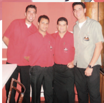
...a Equipe Akashi e o melhor atendimento à você.